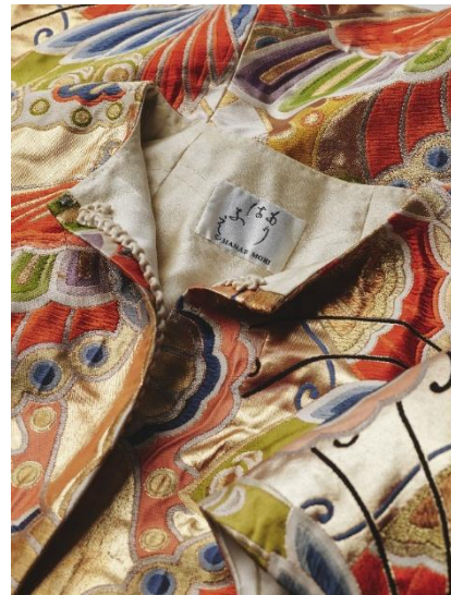
森英恵《ブランドラベル、帯地のコート》1964年 ハナエ・モリ 島根県立石見美術館