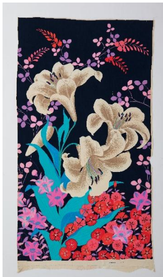
右近テキスタイル デザインハウス テキスタイル 「晩夏に咲く」四季ファブリックハウス 1972年 森英恵事務所

1965年、アメリカへと活動の場を広げた森英恵は、着物文化を背景に成熟していた日本産の帯地や絹織物で制作した作品を発表しました。高品質な絹地に鮮やかな色彩のプリントを施したオリジナルの布地は日本的美の表現としてすぐに注目を集めるようになります。本展では、森が使用した衣装の布地について改めて調査を行った結果、新たに発見された布の原画や試し刷りについても展示します。