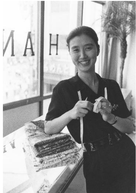
「ひよしや」開店の頃 1950年代半ば