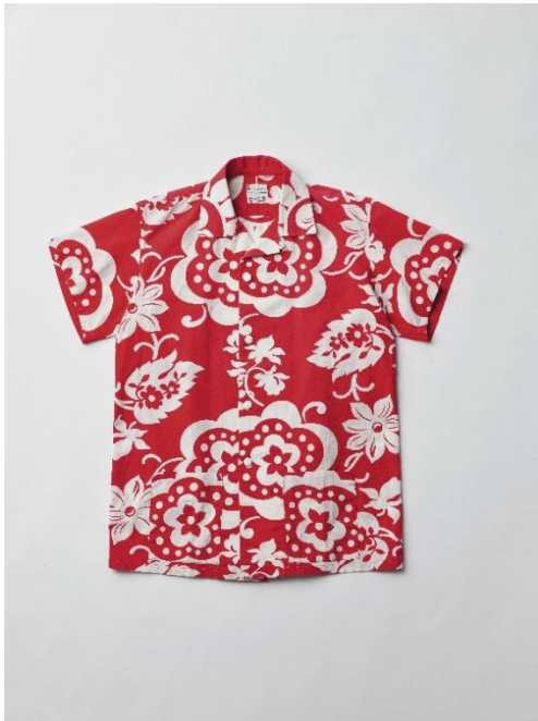
森英恵 《赤い花柄の男性用アロハシャツ (映画『狂った果実』衣装)》1956年 島根県立石見美術館

「ヴァイタル・タイプ」とは、森が1961年1月号の雑誌『装苑』で提唱した人物像です。生き生きとして生命力に溢れ、 びんしょう 敏捷げに目を光らせた女性。そして、一生懸命になれる仕事を持ち、努力を惜しまない活動家。それはまさに森英恵自身の姿とも重なるものでした。ここでは当時の取材記事を取り上げ、森自身が「アーティストであり、働く女性であり、妻であり母である」という新しい女性イメージを牽引する存在だったこと、そうした姿を洋服を作ることを通して創出していた様子を辿ります。また、森自身がこの時期に中心的に取り組み、その後の活動を軌道に乗せる大きなきっかけとなった映画衣装の仕事についても紹介します。