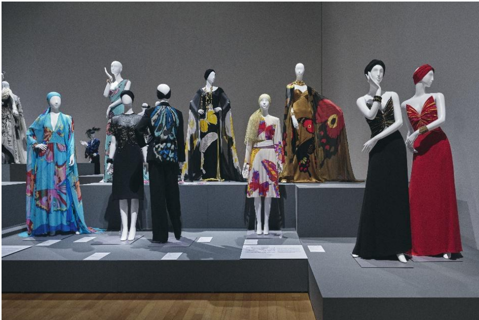
「生誕100年 森英恵 ヴァイタル・タイプ」展示風景 島根県立石見美術館