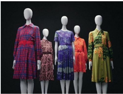
森英恵《ハナエ・モリ バンロン・コレクション》 1969～70年代ヴィヴィッド 島根県立石見美術館

1969年に販売を開始した発色豊かなカジュアルドレスは、当時の国鉄キャンペーンが気運を高めた若い女性の旅行ブームと相俟って大変な人気を博しました。バンクロフト社製の新素材を使ったドレスで、きちんとした仕立てで品がよく、簡単に洗えてシワにならないという機能性を備えており、森が望んだ「実用に適していて、夢をあたえるような」既成服でした。ここでは人々の暮らしの質を底上げした森の既成服事業について取り上げます。