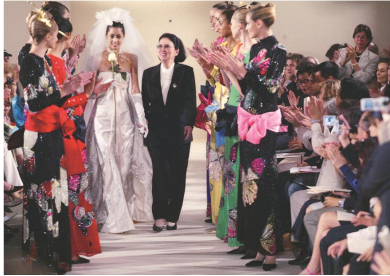
ハナエ・モリ ファイナルオートクチュールコレクション 2004年7月7日

1977年から27年間にわたり森英恵がライフワークとして取り組んだ膨大な数のオートクチュールコレクションからテーマごとにドレスを展示します。高品質な素材と卓越した技術を持って世界に挑んだ一点ものの作品群から森の美意識と創造力の高さを体感できます。