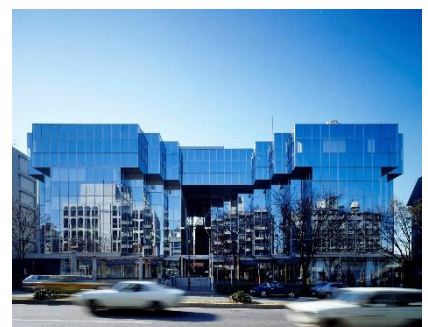
設計：丹下健三 ハナエ・モリビル 1978年