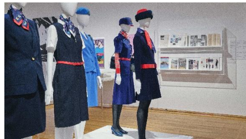
森英恵《ハナエ・モリ バンロン・コレクション》 1969～70年代ヴィヴィッド 島根県立石見美術館