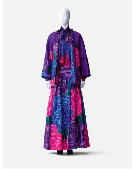
森英恵《イヴニングアンサンブル (ジャケット、ブラウス、スカート)》1977年秋冬 ハナエ・モリ オートクチュール

1977年、森はパリ・オートクチュール組合の正会員となり作品発表を始めます。これは日本に続きアメリカでの活躍も認められ、作品のオリジナリティやアーティストとしての社会的信用が評価されたことで実現した、アジア人初の快挙となりました。森はそれまでの独自の色や柄を生かす作品に加え、パリではオートクチュールならではの素材や技巧をつくした作品作りに挑戦し、創作の幅を広げていきました。ここでは「刺す」「織る」「たたむ・重ねる」「墨絵」「花」「白と黒」「お嫁さん」など、技法や素材に注目したテーマを立て、1977年のデビューコレクションから、2004年のファイナルコレクションまでを網羅的に展覧します。