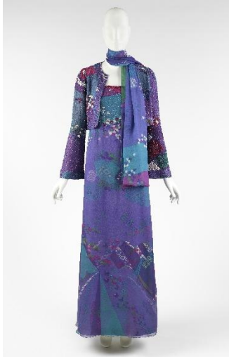
森英恵《イヴニングアンサンブル》1968年 ハナエ・モリ メトロポリタン美術館、ニューヨーク 1975年 森英恵氏寄贈(1975. 86. 1a-c)

今回、ニューヨークのメトロポリタン美術館に収蔵されている森英恵のドレスを日本にて初めて紹介します。森の顧客であり、日本美術の高名なコレクターであったメアリー・グリッグス・バークは、自身が所有する伊藤若冲《月下白梅図》(1755年)から着想を得たドレスの制作を森英恵に特別に依頼。このドレスを含む、森英恵作品4点が東京展のために出品されます。本展では多くの衣装、資料を通じ、これまであまり紹介されてこなかった森のアメリカ時代の活躍を網羅的に伝えます。