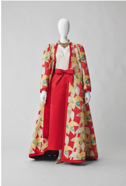
森英恵 《イヴニングアンサンブル (コート、ドレス)》 1968年 ハナエ・モリ 島根県立石見美術館

島根県立石見美術館所蔵の《イヴニングアンサンブル(ジャンプスーツ、カフタン「菊のパジャマドレス」)》も写真家リチャード・アヴェドンによる撮影で『ヴォーグ』に大きく取り上げられ、アメリカ時代の森英恵の活躍を象徴する一作です。本章でメトロポリタン美術館所蔵の作品を展示し、森のアメリカ時代の足跡に迫ります。ここでは当時、森英恵が協働して布地を制作し、現在でも稼働を続けている布作りの現場取材した撮り下ろし映像も上映します。